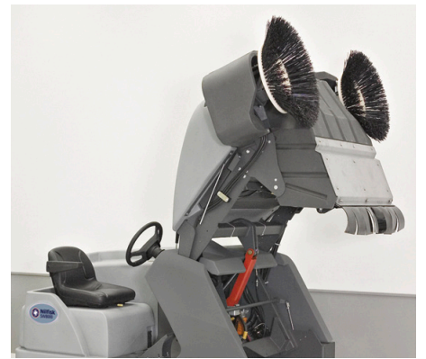
La SW8000 tiene una gran capacidad en su tolva de 152 cm desde el nivel del suelo para un llenado práctico.