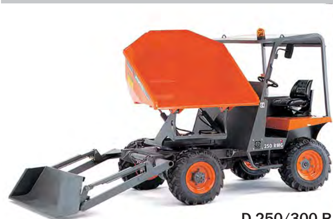
D 250/300 R