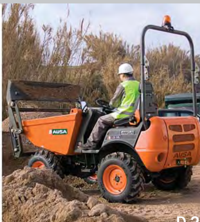
D 201 R