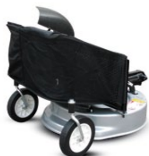
CORTACÉSPED 56 CM / CORTA RELVA 56 CM