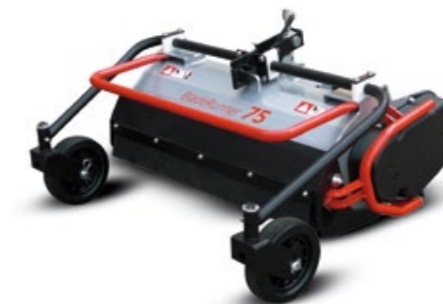
BLADERUNNER / BLADERUNNER