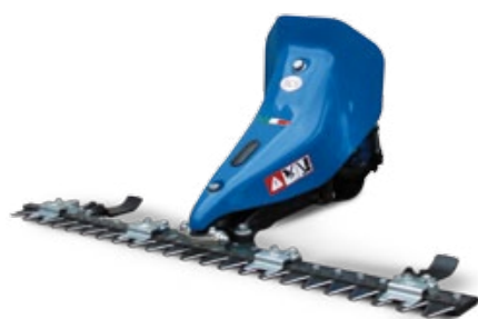
BARRA DE SIEGA / BARRA DE CORTE