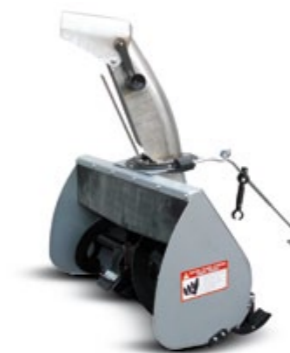
QUITANIEVE DE TURBINA / LIMPA NEVES DE TURBINA