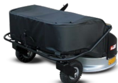
CORTACÉSPED 100 CM / CORTA RELVA DE 100 CM