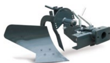
ARADO MONOSURCO / CHARRUA