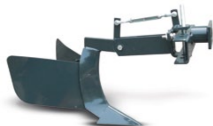
SURCADOR / ABRE-REGOS