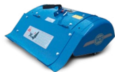
FRESAS / FRESAS