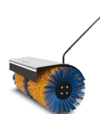
BARREDORA / VARREDORA