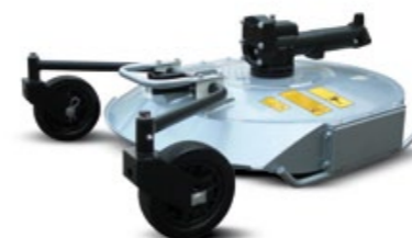
DESBROZADORA DE CUCHILLA DE 80 CM DESTROÇADORA DE LÂMINA DE 80 CM