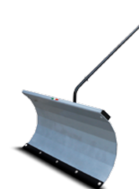
PALA BARRE NIEVE / PALA LIMPA NEVE