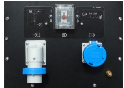
Panel de control estándar

La carrocería de la nueva Linktower T3 ha sido diseñada para ofrecer una mejor protección ante la lluvia al panel de control.